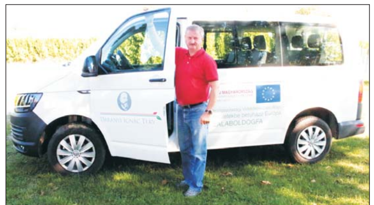
Az új falugondnoki busszal a szolgáltatást is fejlesztik.

A százezer kilométert futott, decemberben hét évessé váló régi jármű leváltására a meglévő falugondnoki szolgáltatás ellátásához kapcsolódóan lehetett pályázni, mellyel a te-