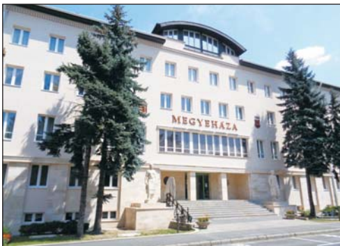
Több fontos témát is tárgyalt a megyei közgyűlés.

A Zala Megyei Közgyűlés 2015. szeptember 24-i ülésén Egri Gyula tűzoltó ezredes, a Zala Megyei Katasztrófavédelmi Igazgatóság igazgatója tájékoztatta a képviselőket a szervezet 2014. évben elvégzett legfontosabb feladatairól és megtett intézkedéseiről, valamint ismertette a 2015. évre kitűzött legfőbb célokat. Elmondta, hogy a 2014. év a komoly kihívások és a megmérettetés éve volt igazgatóságuk számára, mivel januárban a havazással, februárban jelentős ónos esővel, májusban az Yvett Ciklon által okozott szélviharral, a nyári hónapokban sárfolyásokkal, majd szeptemberben az áradásokkal kellett felvenniük a küzdelmet. Összességében megállapítható, hogy az általános és célirányos felkészüléseknek és az eddigi védekezések során