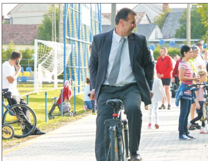
Vigh László országgyűlési képviselő a kormányra ülve háttal is kerékpározott.

Bagod és Teskánd községek konzorciumot alakítva pályázatot nyújtottak be a 2 településen lévő, régi vasúti töltésen haladó kerékpárút építésére, melynek első üteme 2014. nyarán épült a bagodi vasútállomástól Teskánd irányába. Idén tavasszal elkezdődtek a második szakasz kivitelezési munkálatai, ennek eredményeképp a bagodi kiindulási ponttól 3 méter széles, korszerű aszfaltcsík kigyózik a teskándi sportpályáig hol egy vasúti híd alatt, hol a Zala folyó felett, kiszolgálva azok igényeit is, akik szeretik az igazán hosszú, majd 1 km-es egyenest.