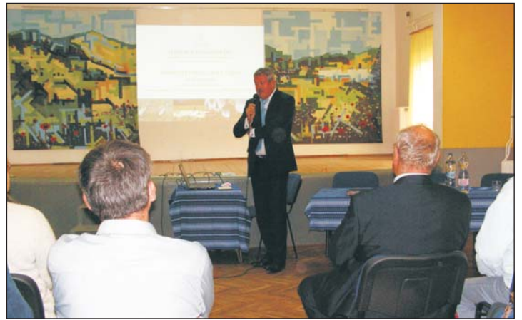
V. Németh Zsolt széles témakörben fejtette ki a vidék helyzetét.

V. Németh Zsolt államtitkár az „Európa a polgárokért” „Környezetvédelem és vidék” címmel beszélt. Számolója szólt többek közt a vidékstratégia megalkotásáról, mint mondta: „A történelem során, nehéz helyzetekben, vidéki gyökerekből táplálkozva a falusi közösségek erejére támaszkodva tudott a magyar társadalom megújulni.” A magyar vidék a maga teremtett világ, társadalom és kultúra, valamint az agrárium harmóniában kell, hogy legyen, a fejlesztések és programok terén. Beszélt továbbá az ország kiváló adottságairól, melyek a kihívások, a klímaváltozás korában megpróbáltatásoknak vannak kitéve, és e negatív folyamatokkal szemben kell létrehozni a stratégiai dokumentumokat. Érintette a pályázati lehetőségeket, amelyek regionális és határon túli progra-