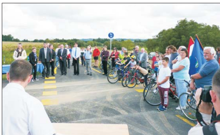
A kerékpárút avatásának nyitó ünnepsége Bagod határában.