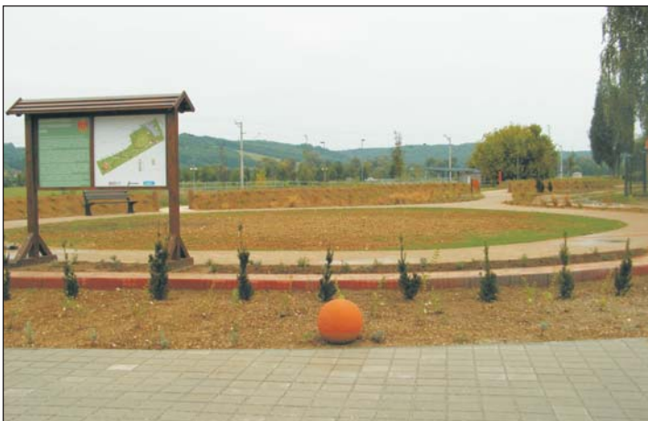
A Testvértelepülési Park.